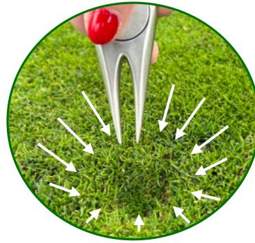
Nach innen drücken und im Kreis arbeiten

Eine Pitchgabel ist empfohlen, aber ein Gerät mit Spitze geht auch z.B. ein langes Holz-Tee