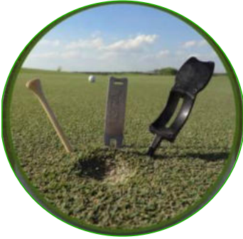
Wähle Dein Werkzeug

Eine Pitchgabel ist empfohlen, aber ein Gerät mit Spitze geht auch z.B. ein langes Holz-Tee