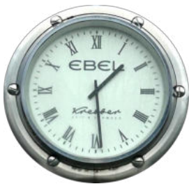
ON TIME STARTEN